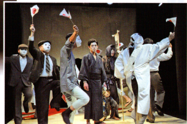
鶴彬を囲み、日の丸を振って軍歌を歌う群衆 (演劇・東京公演より)

世の中が軍国主義に染まる中、民衆の内なる声を訴え平和を訴え続けた鶴彬。昨秋、鶴彬の生涯を描いた演劇で主役を演じた青年の目を通して、鶴彬が私たちに託したメッセージに迫ります。 ※2015.5.23 石川テレビで上映 (55分)