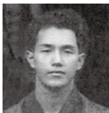
鶴彬 (つるあきら) 本名・喜多一三 (きたかず) 喜多一三(後の鶴彬)は、1909(明治42)年1月1日、石川県かほく市(旧石川県河北郡高松村)の竹細工職人・喜多松太郎、寿ずの次男として生まれた。

岡崎裕亮 中里和寛 仁野美海 佐々木具視 中川佳奈 中山優子 間宮一輝 島上かんな 新保正 春海圭佑 and more